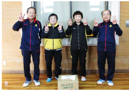
混合団体60歳以上 優勝 スマイル会A