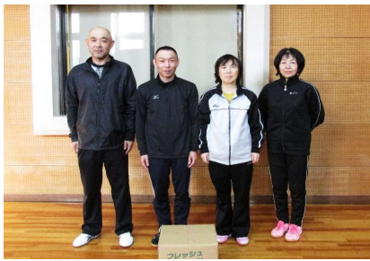
混合団体59歳以下 2位 余目クラブ