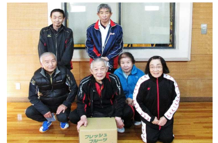
混合団体70歳以上 2位 チーム山形