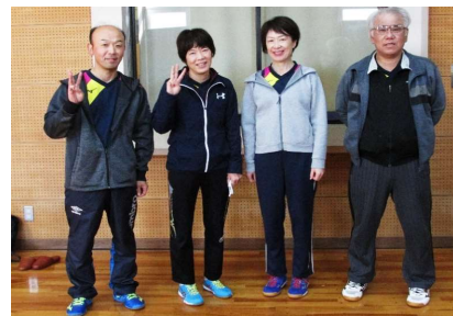
混合団体59歳以下 3位 スマイル会A