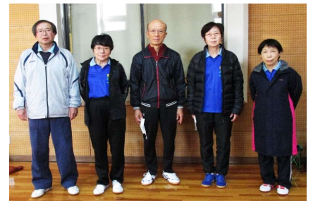
混合団体70歳以上 優勝 山形クラブA