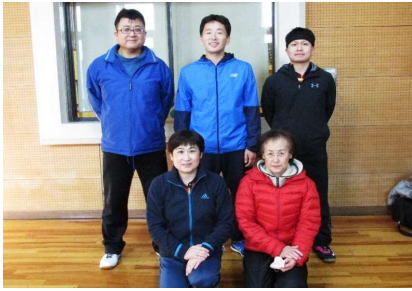
混合団体59歳以下 優勝 チーム山形A