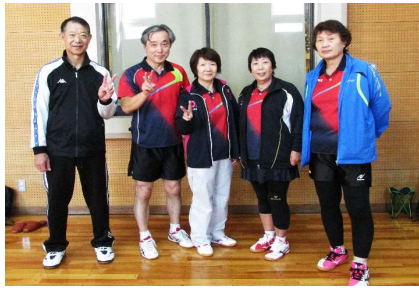
混合団体60歳以上 3位 天童クラブ