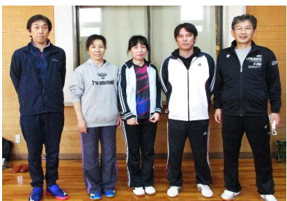
混合団体59歳以下 3位 つばきクラブA