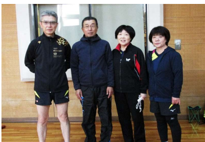
混合団体60歳以上 3位 スマイル会B