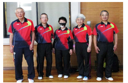
混合団体70歳以上 3位 天童クラブ