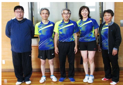
混合団体60歳以上 2位 余目クラブ