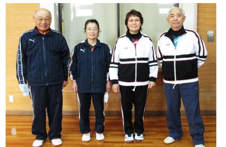
混合団体70歳以上 3位 長井ラーニングクラブ